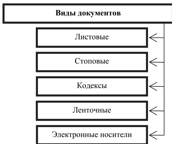
Рис. 3.1. Виды документов по конструктивной форме

Виды документов по конструктивной форме. Конструктивная форма документа отличается огромным разнообразием (рис. 3.1).