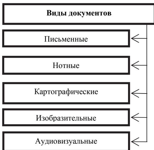
Рис. 3.2. Виды документов по знаковой природе информации

Виды документов по знаковой природе информации. Еще один признак, участвующий в видообразовании документов, это знаковая природа информации. Она определяется как форма знаков, при помощи которых фиксируется и передается основной материал издания: буквы алфавита, цифры и знаки препинания (для произведений письменности), нотные знаки (для музыкальных произведений), изображения графические, художественные и картографические (рис. 3.2).