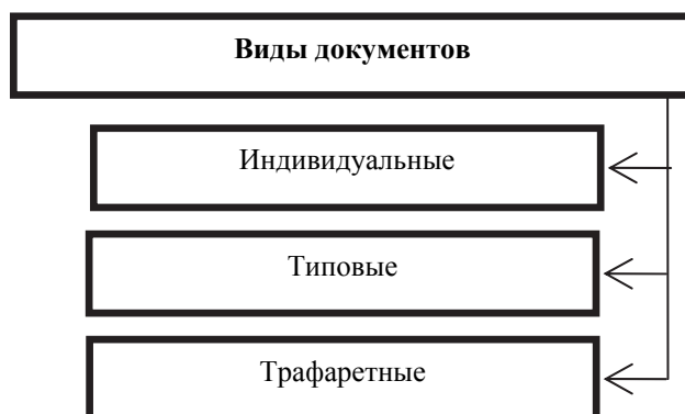
Рис. 3.4. Виды документов по характеру текста

Виды документов по характеру текста. Документы подразделяются по характеру текста на индивидуальные, отражающие авторский взгляд на проблему; типовые, стремящиеся к стандартной форме текста; трафаретные типографские бланки с пустыми графами (рис. 3.4).