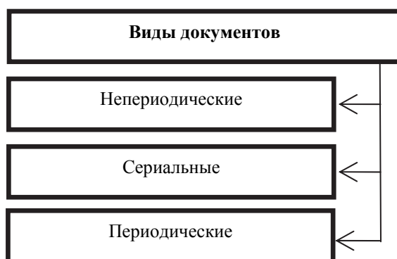
Рис. 3.3. Виды документов по периодичности

Виды документов по их периодичности. С точки зрения периодичности выхода в свет все издания подразделяются на непериодические, выпущенные однократно, не имеющие продолжения, чаще всего – книги; сериальные, периодические – сериальные издания, выходящие через определенные промежутки времени (рис. 3.3).